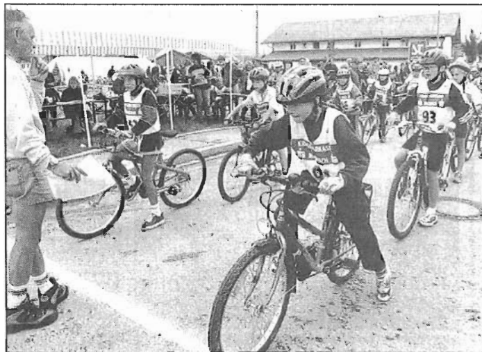
Jedes Jahr lieferten sich bis zu 400 Nachwuchssportler in Miesbach einen spannenden Dreikampf in den Disziplinen Schwimmen, Radfahren und Laufen.